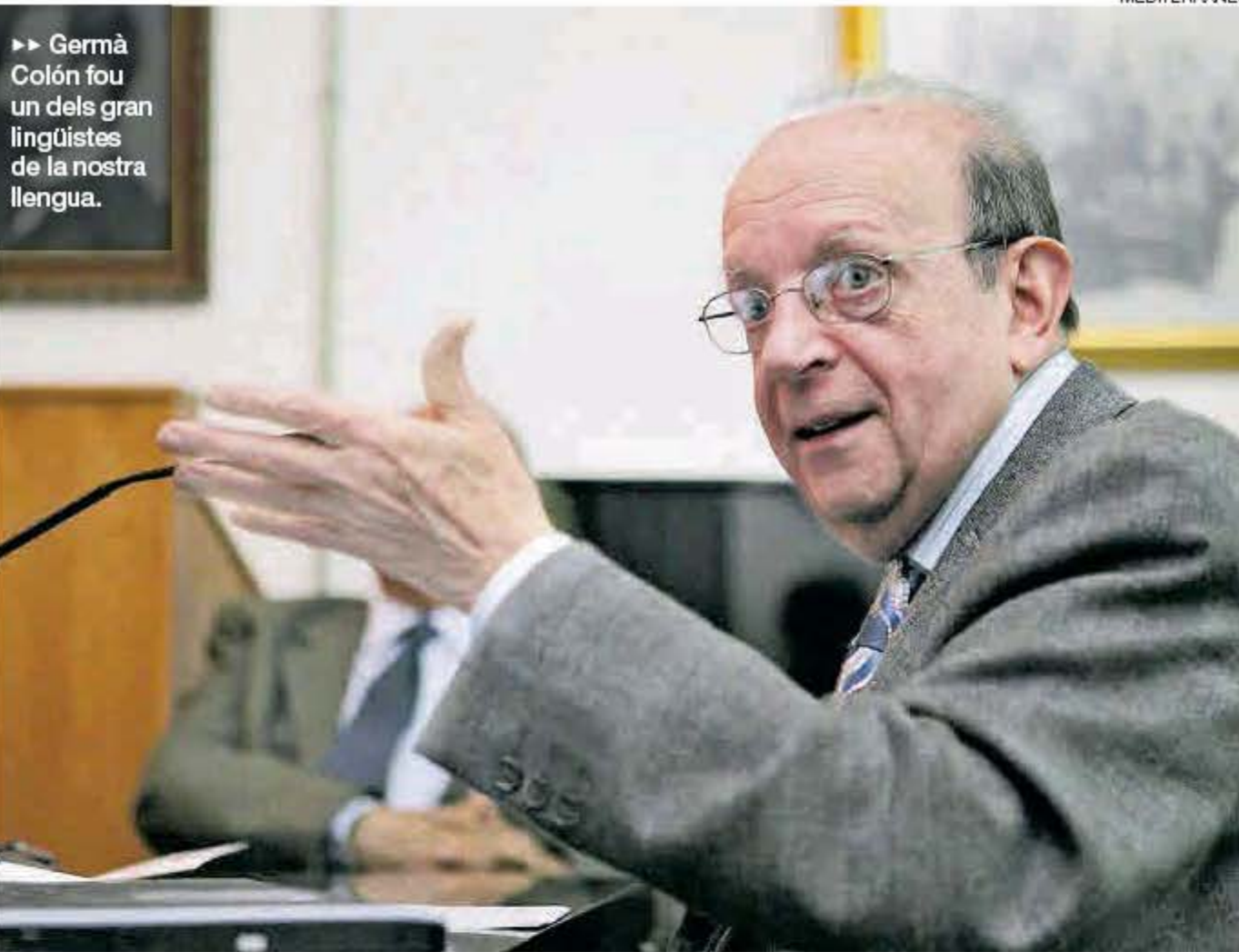
►► Germà Colón fou un dels gran lingüistes de la nostra llengua.