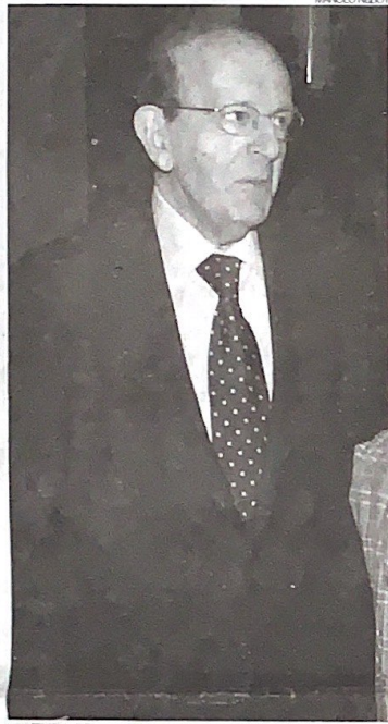
► El lingüista castellonense Germà Colón.