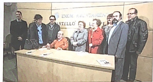
El profesor con familia y allegados. CARMÉ RIPOLLÉS